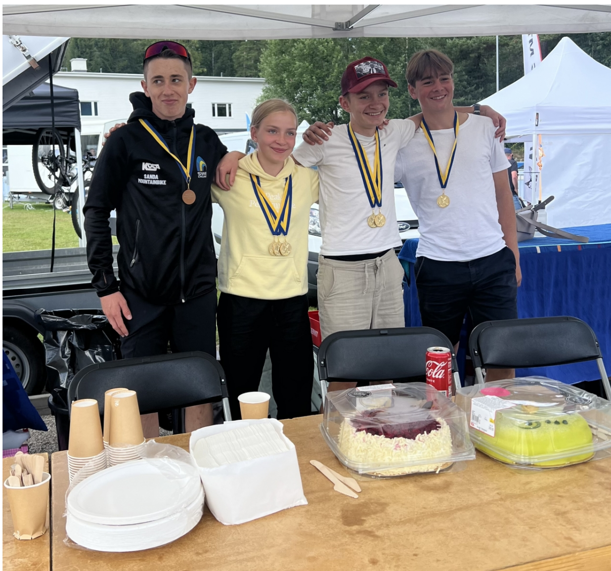
SM XCO i Borås, med tårtkalas